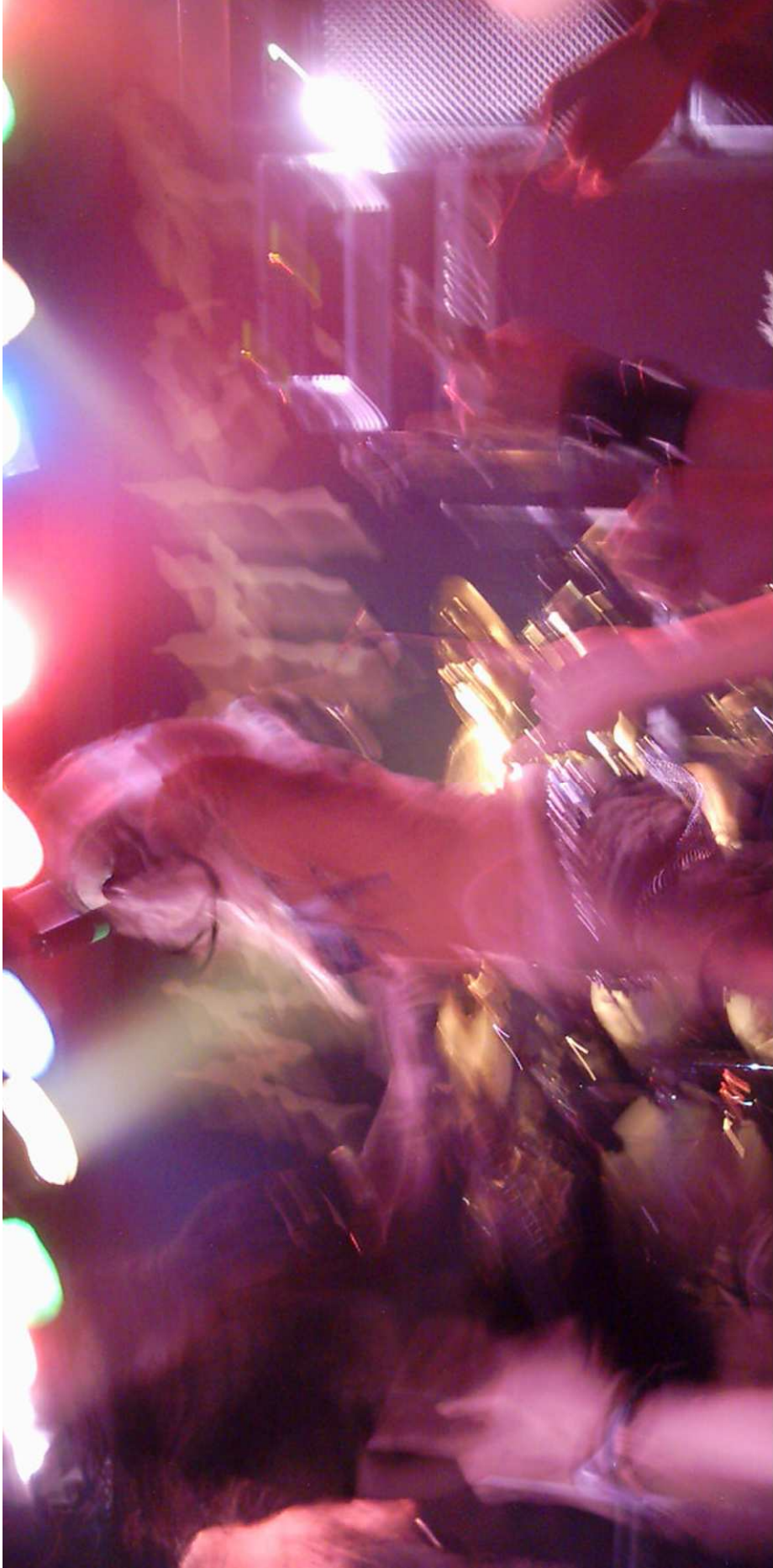
BJORN10.PENSAMENT-CREACIÓ: MÉS FORT! CRIDA PER MI! VULL MÉS POTÈNCIA!